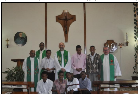
Wizyta O. Mariusza w Prenowicjacie w Tamatave

którzy ufając nam, przyprawdzali swoje dzieci do naszej katolickiej szkoły.