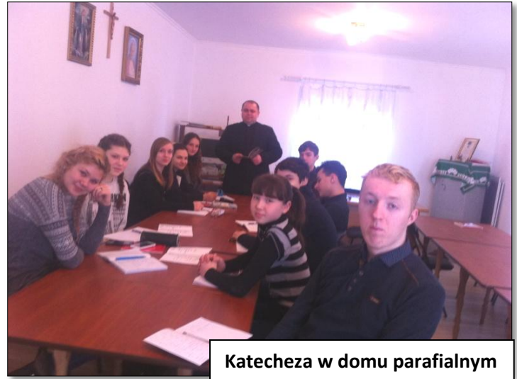
Katecheza w domu parafialnym