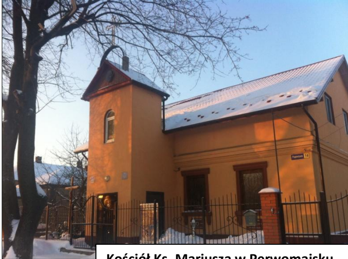
Kościół Ks. Mariusza w Perwomajsku

pomieszczenia mieszkalne księży. Od 2007 roku już na stałe mieszka ksiądz przy parafii. Obecnie nasza parafia liczy około 50 osób. W domu parafialnym prowadzimy katechezę i nauczanie języka polskiego dla dzieci, młodzieży i dorosłych, spotkania duszpasterskie. Ostatnio zorganizowaliśmy w tej sali wigilię dla wszystkich parafian. W parafii jest również grupa ministrantów i lektorów. Założyliśmy także Polskie Towarzystwo Kultury, w skład którego wchodzi osoby nieprzynależące do naszej parafii. Celem tej organizacji jest zapoznanie mieszkańców z polską kulturą i religijnością, a poprzez to ewangelizujemy i doświadczamy, że wiele osób przyjmuje wiarę katolicką, następnie sakramenty. Chodzimy do domów dziecka, żeby poprzez śpiew, gry i zabawy ewangelizować, gdyż nie możemy robić tego wprost, lecz z