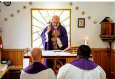
Uroczyste Błogosławieństwo Misjonarzy