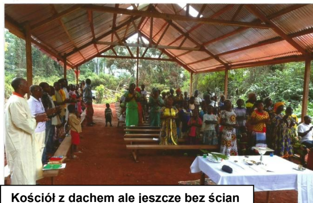
Kościół z dachem ale jeszcze bez ścian

Z Prokury Misyjnej kierujemy do Was, Drodzy Przyjaciele Misji Oblackich, gorące podziękowania za wszystkie dary duchowe i materialne. Zapewniamy o naszej pamięci, o codziennie odprawianych Mszach świętych we wszystkich Waszych intencjach. Niech Wam błogosławi Wszechmogący Bóg – Ojciec, Syn i Duch Święty. Amen.